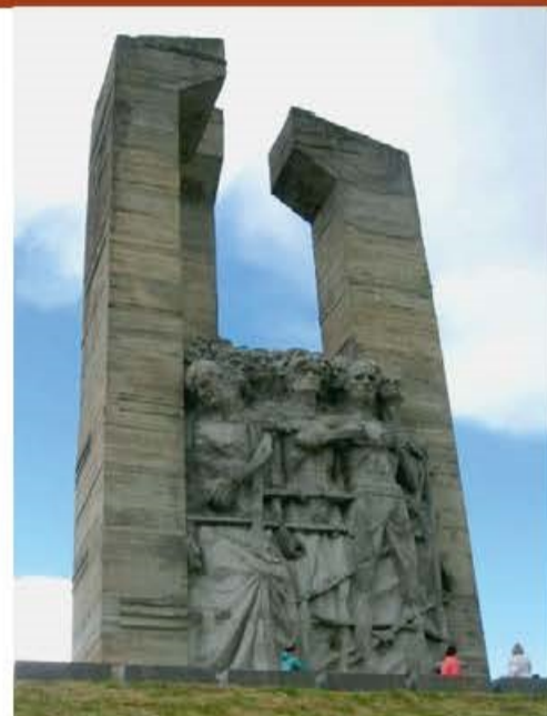
Мемориал жертвам «Дулаг 100», Псковская область

Правда, фашисты планомерно вылавливали из толпы пленных и истребляли всех политработников и сотрудников НКВД, однако эти «нелюди» умудрялись не только сохранять свою жизнь, но и занимать довольно высокое положение по сравнению с остальными.