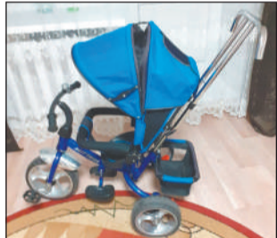
Продам велосипед-коляску. Ц: 1500р. Т. 8-987-871-26-56