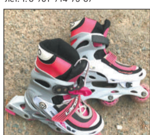
Продам ролики с защитой, р-р 31-34. Ц: 1500р. Т. 8-912-354-90-01 (смс или WhatsApp)