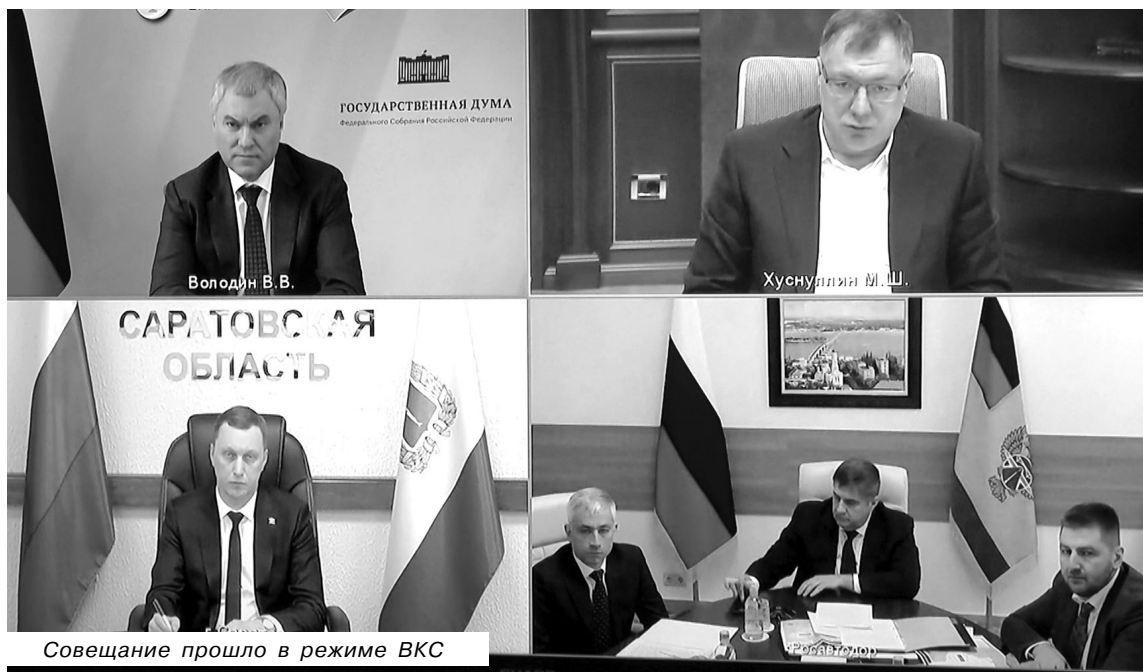
Совещание прошло в режиме ВКС

сказал слова благодарности заместителю председателя Правительства Российской Федерации Марату Хуснуллину за поддержку региона, отметив, что подходы и эф-