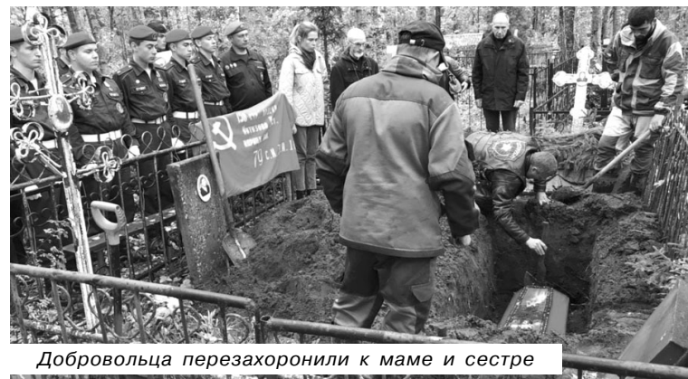
Добровольца перезахоронили к маме и сестре