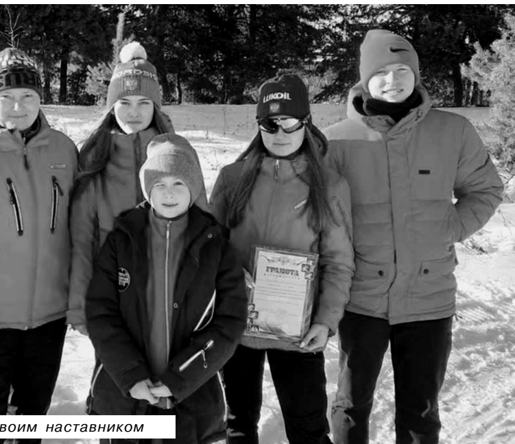
Карабулакские лыжники со своим наставником

Призёры и победители награждены грамотами главы администрации Новобурасского района.