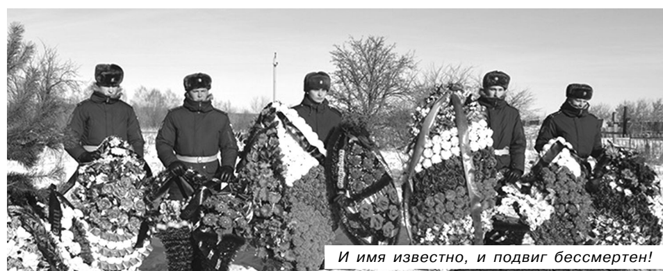
И имя известно, и подвиг бессмертен!