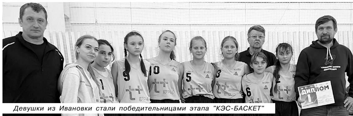
Девушки из Ивановки стали победительницами этапа "КЭС-БАСКЕТ"