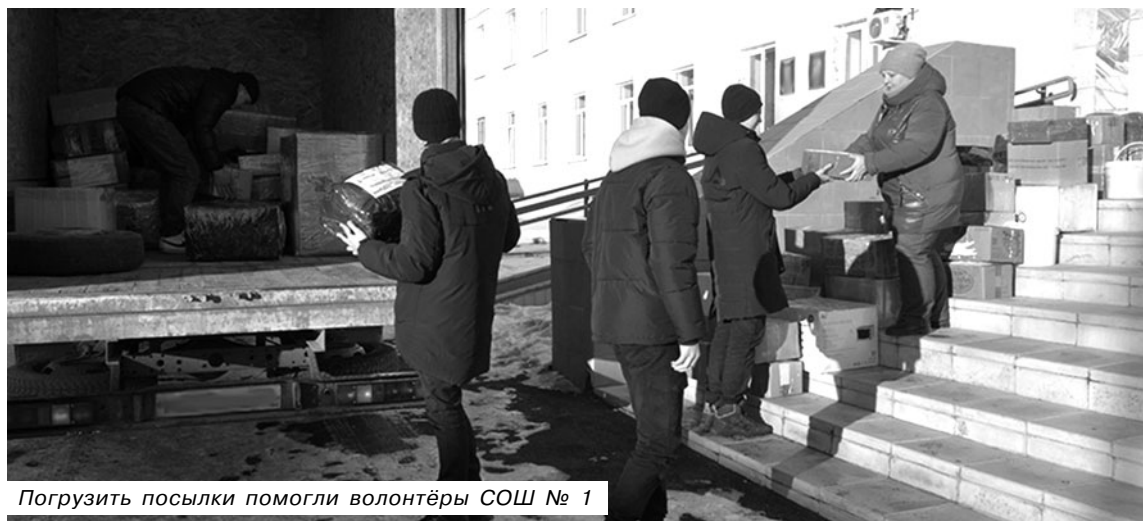
Погрузить посылки помогли волонтеры СОШ № 1