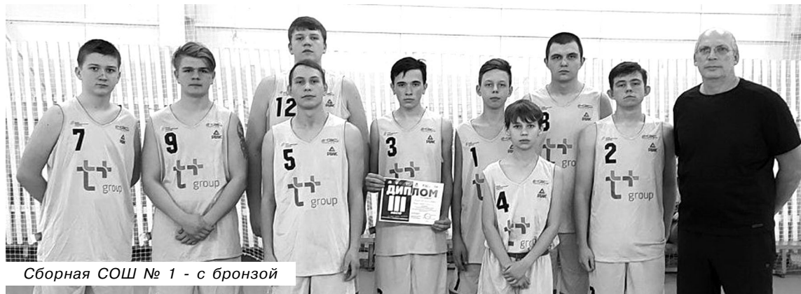
Сборная СОШ № 1 - с бронзой

ЗАМЕСТИТЕЛЬ министра спорта Российской Федерации Одес Байсултанов анонсировал долгожданное изменение структуры комплекса ГТО.