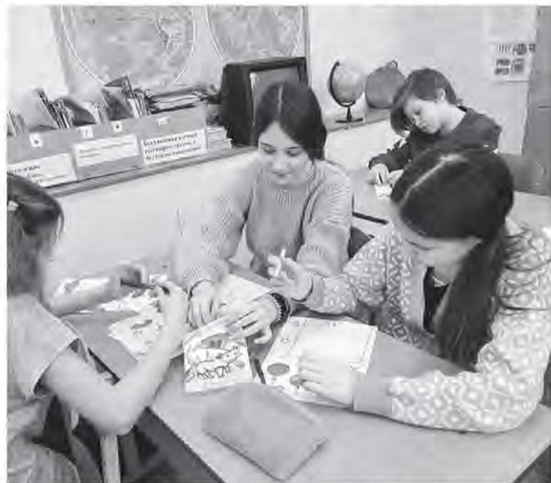
Ученики Бурёнковской школы благодарны зипуновцам за приют, но с нетерпением ждут возвращения в своё здание.