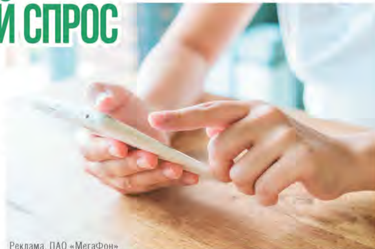
Реклама. ПАО «МегаФон»

Среди брендов по итогам года лидирует Samsung, его доля в продажах на вторичном рынке – 35,5%. Это может быть связано с более широким модельным рядом в различных ценовых категориях. На второй строчке расположились устройства от Apple (28%), а топ-3 рейтинга замыкает Xiaomi (15%).