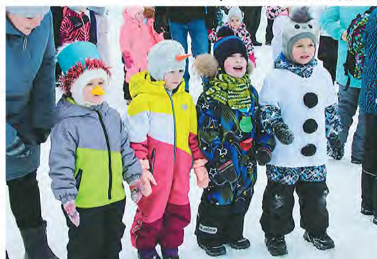
Забег Снеговиков: детвора на старте.