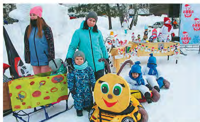
Каких только чудо-саней не было на фестивале! Фантазии участников можно позавидовать.