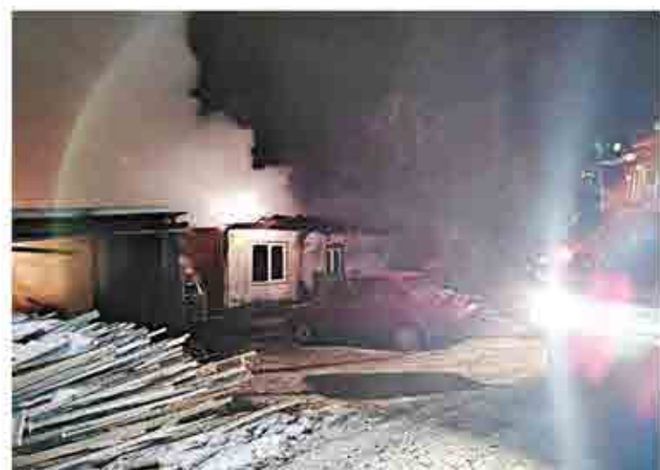
Автомобиль, стоявший недалеко от дома, не пострадал