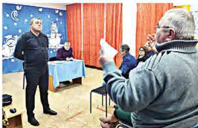
Проблем много, особенно у жителей отдаленных поселков, где осталось несколько жилых домов

Жители громко протестовали: «Так постройте дом для медиков и учителей, часть обязательств выполните. А может быть, проблема в руководстве ЦРБ?»