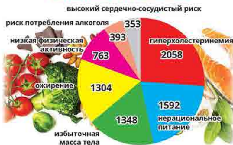
(человек, по итогам диспансеризации и профосмотра)