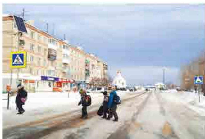
Правила дорожного движения созданы ради сохранения жизни

Участвуйте в наших конкурсах, и пусть вам повезет!