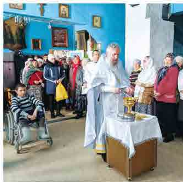
В храмы приходят пожилые, заглядывает и молодежь. Пришедшие участвуют в службах, ставят свечи за здоровье, за упокой, причащаются. Посещение храма оставляет добрый след в душе. Многие понимаешь, стоя у иконы