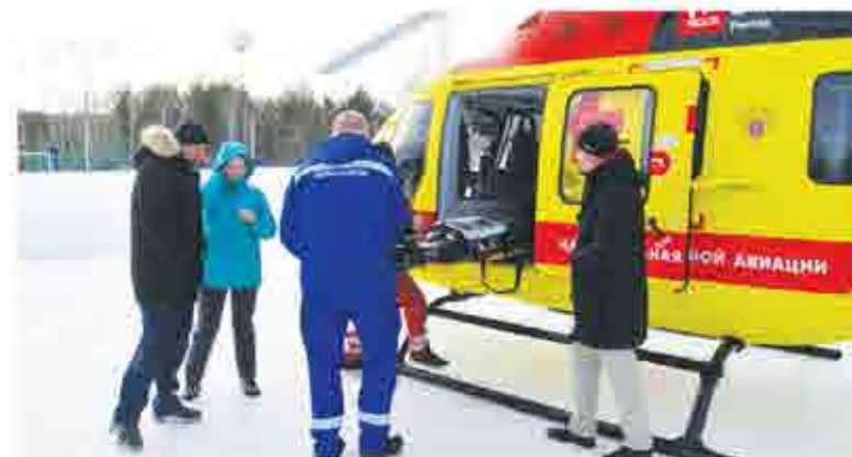
Все чаще для экстренной помощи медики используют вертолет Центра медицины катастроф

Как оказалось, в Артемовскую ЦРБ привезли пациентку из Алапаевского района. У нее было подозрение на острое нарушение мозгового кровообращения, но проведенная компьютерная томография не