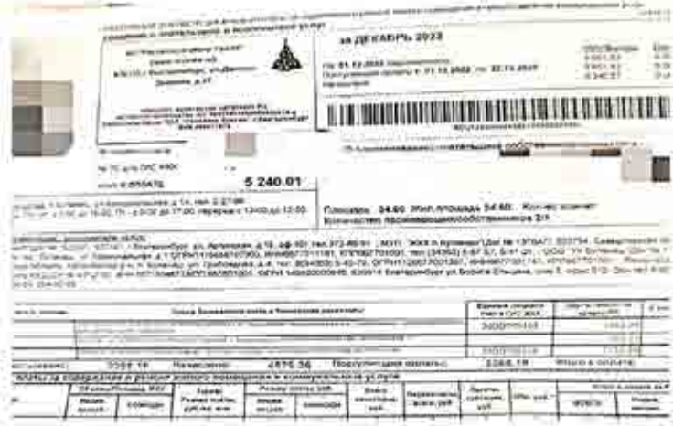
В квитанциях за декабрь от “РЦУ” буланашцы последний раз получили счета за ХВС и водоотведение

По предварительной договоренности с 10 февраля он начнет вести прием населения два раза в неделю на площадке МУП “Буланашское ЖКХ” по адресу: п. Буланаш, ул. Коммунальная, 1.