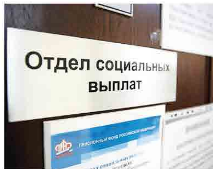
С вопросами о пособиях обращайтесь в Соцфонд. Он работает в здании бывшего ПФР

По повышению пособий, выплат и компенсаций с 1 февраля 2023 года обращайтесь в Социальный фонд по адресу: ул. Гагарина, 9-А.