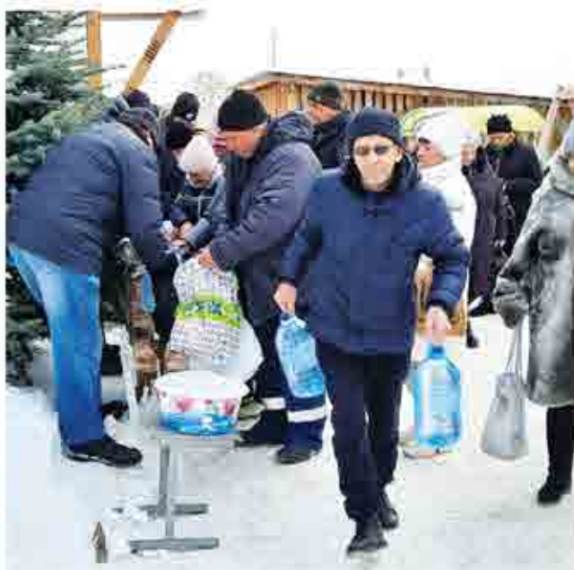
Святую водицу увозили домой канистрами и большими бутылками. Запасают ее не только для себя, но и часто - на всю семью, пожилых соседей, товарищей по работе. И, знаете, не жадничают те, кто заполучил воду в Крещение - хотя бы баночку, да нальют страждущему и просящему