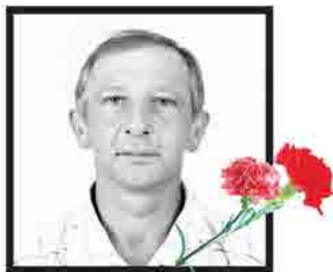
24 января исполнилось полгода, как ушел из жизни любимый и дорогой наш человек