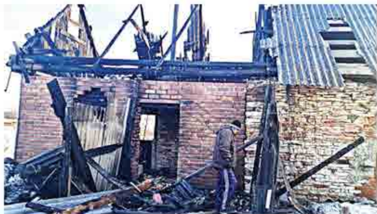
Более позднее строение (справа) осталось не тронутым огнем. Чего не скажешь о пристрое