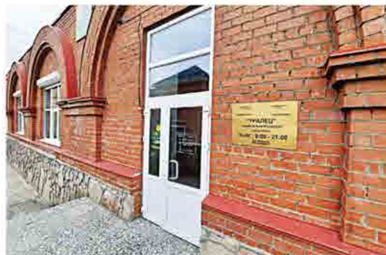
Очередной скандал чуть не разгорелся вокруг доступа в бассейн