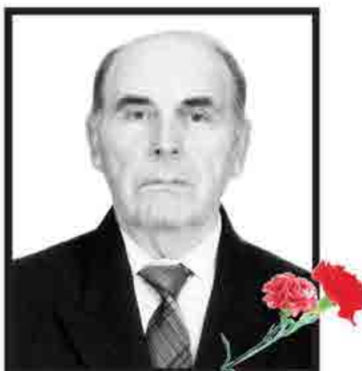
31 января исполнится 40 дней, как нет с нами нашего дорогого и любимого человека