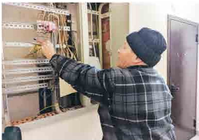
Вот здесь вырезали кусок медного провода длиной 40 сантиметров и обесточили квартиры

В стеклянной входной группе первого подъезда дверь оказалась без стекла, а ручка на металлической входной двери и доводчик с магнитом сломаны. Домофон отсутствует, вход в подъезд свободный. На стенах подъезда надписи, да и сами стены, окрашенные в розовый цвет, выглядят обшарпанными и засаленными.