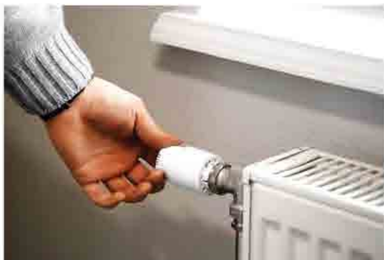
Чтобы поддерживать температуру, из батарей сливают воду

Коммунальщики намерены наказать хозяйку оранжереи, сливающую воду из батарей