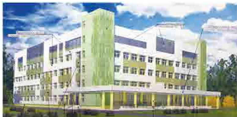
Весна в центральном медгородке придет со строительством долгожданного лечебно-диагностического корпуса

Заказчиком строительства лечебно-диагностического корпуса больницы является УКС Свердловской области, подрядчик определен - это ООО "Виктория Строй". Стоимость работ была объявлена в 996,5 млн рублей.