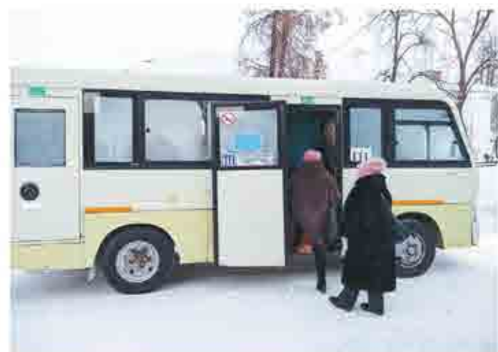
«Но бывает, что автобусы ломаются и не всегда выдерживается график их движения», - отмечают в УГХ / ФОТО: МИХАИЛ ДУДИН, "ЕВ".

В городе должны работать не менее 21 единицы пассажирского транспорта (минимум на 18 пассажирских мест), на сельских направлениях - 10 единиц техники (минимум на 30 пассажирских мест).