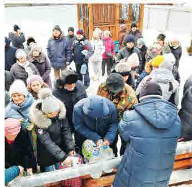
Тихая очередь выстроилась к раздаче воды у храма во имя святого пророка Божия Илии на ул. Советской. Здесь несколько лет как организовали своеобразный водопровод на улице. Удобно!