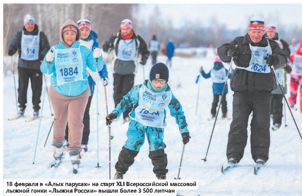
18 февраля в «Алых парусах» на старт ХLI Всероссийской массовой лыжной гонки «Лыжня России» вышли более 3 500 липчан