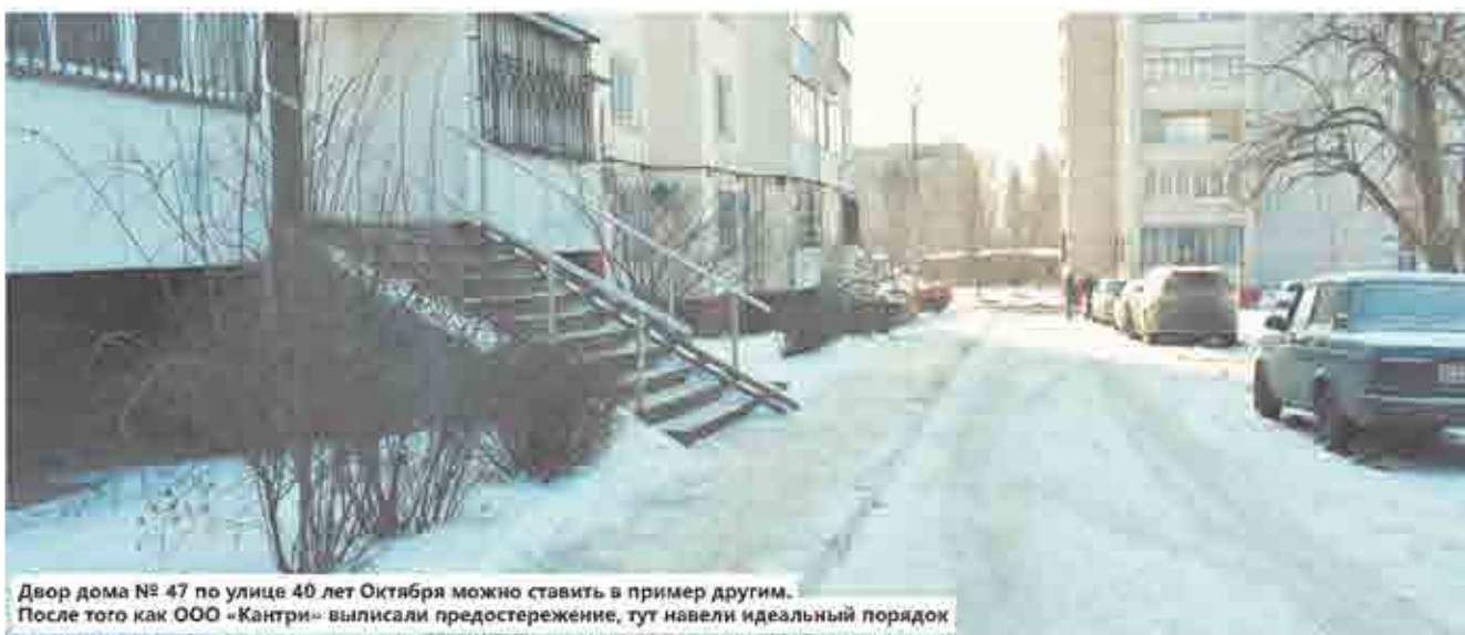
Двор дома № 47 по улице 40 лет Октября можно ставить в пример другим. После того как ООО «Кантри» выписали предостережение, тут навели идеальный порядок

— Это всё с сентября лежит, — кричит одна из жительниц первого этажа, высунувшись из окна. — Я уже сто раз в УК «Перспектива» звонила, мол, собаки растаскивают мешки, когда увезёте — а им до нас никакого дела нет. Я за квартиру в 40 метров каждый месяц плачу по 800 рублей, все платим. Куда идут наши деньги? Подъезд вообще не моют, годами. Такая жуть — гостей на день рождения стыдно пригласить.