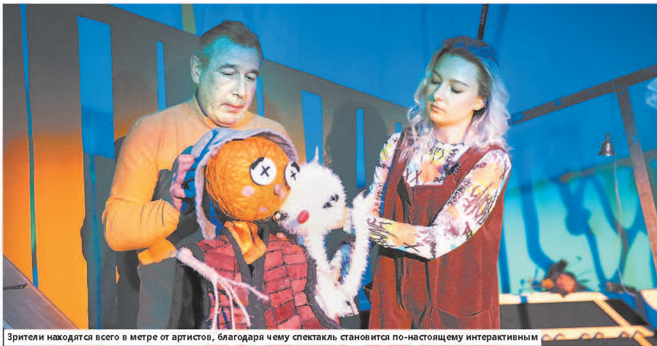
Зрители находятя всего в метре от артистов, благодаря чему спектакль становится по-настоящему интерактивным

Текст: Анна Дикарева