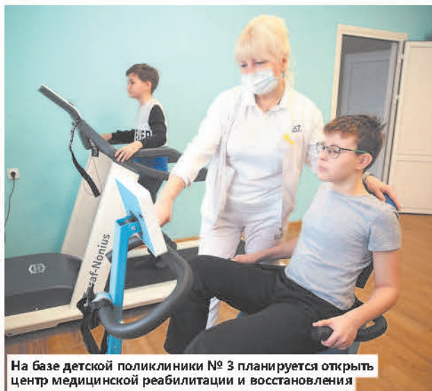
На базе детской поликлиники № 3 планируется открыть центр медицинской реабилитации и восстановления

медицинскую помощь. Речь не только о развитии материально-технической базы медицинских учреждений. В числе других ключевых приоритетов — наращивание возможностей для оказания специализированной и высокотехнологичной помощи, повышение уровня подготовки медицинских специалистов, а также более широкое использование передовых информационных технологий, в том числе так называемых цифровых помощников, которые помогают врачам в постановке диагнозов, сокращают время на заполнение документации. Планы по развитию здравоохранения в стране у нас большие, и, несмотря на те сложности, которые нам пытаются создать извне, мы их все реализуем. Более того, у нас есть все возможности реализовать эти планы досрочно, в том числе по наиболее чувствительным направлениям, таким как развитие первичного звена здравоохранения.