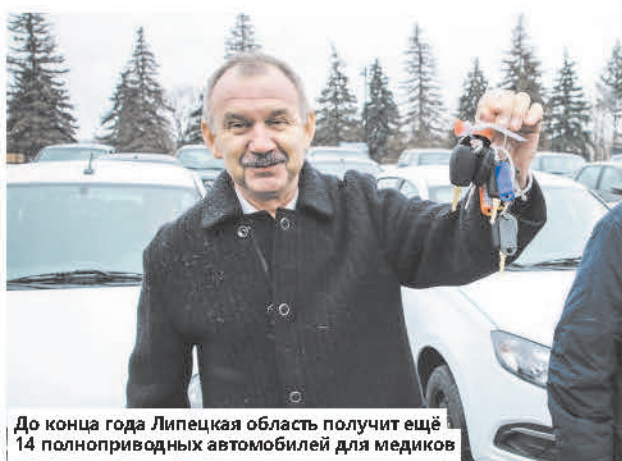
До конца года Липецкая область получит ещё 14 полноприводных автомобилей для медиков

На площади Ленина-Соборной главврачи районных и центральных районных больниц области получили ключи от 42 новых автомобилей «Лада Трэвел» и «Лада Гранта». Эти машины будут доставлять пациентов в больницы и поликлиники, а медицинских работников на дом к больным. Кроме того, служебные автомобили позволят обеспечить перевозку биологических материалов для исследований и доставку лекарственных препаратов до жителей отдалённых районов.