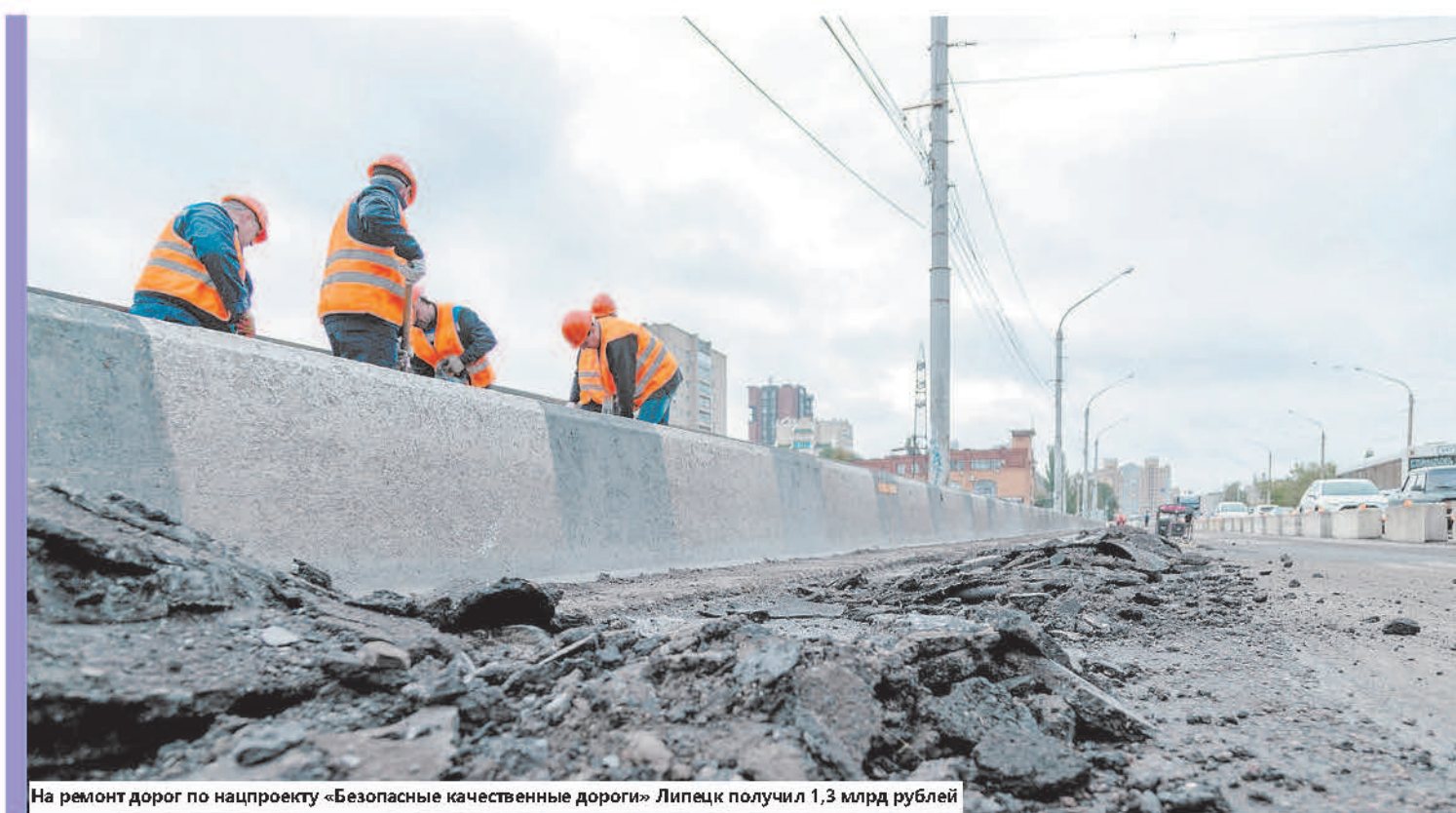
На ремонт дорог по нацпроекту «Безопасные качественные дороги» Липецк получил 1,3 млрд рублей