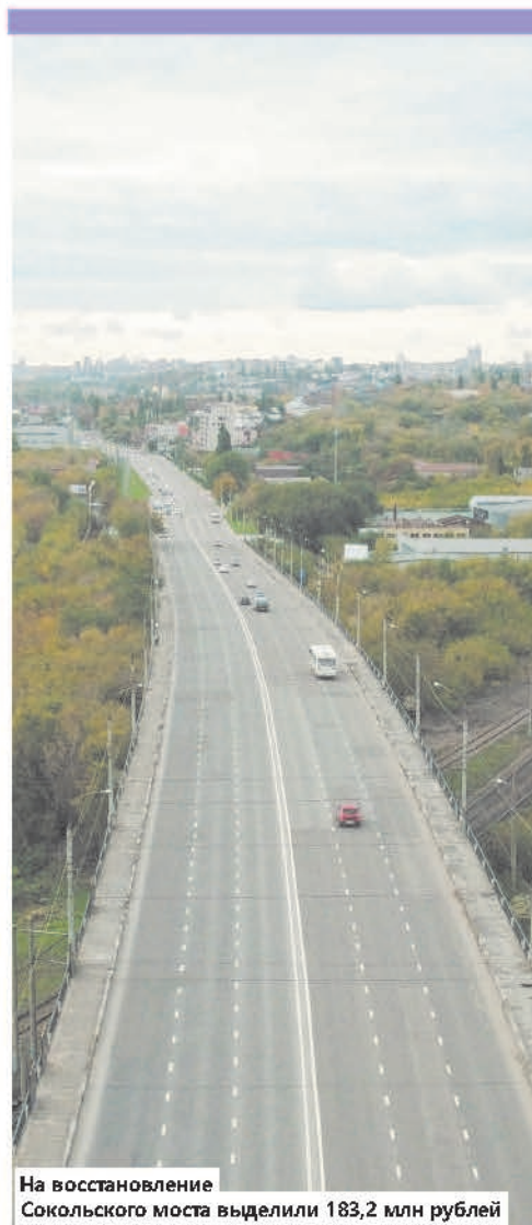
На восстановление Сокольского моста выделили 183,2 млн рублей

Но главный смотритель города заверил, что сложностей с передвижением липчан не будет. На Октябрьском мосту работы по замене дорожного полотна не запланированы. Там будет только усиление несущих конструкций, восстановление защитного слоя бетона, защита арматуры от коррозии. Перекрывать этот мост не планируют.