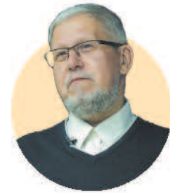
Сергей Переслегин, прогнозист

Что ещё важного произошло за этот год — общество начало меняться. Началась зачистка от либеральных ценностей. У нас произошёл консервативный поворот. Ещё один