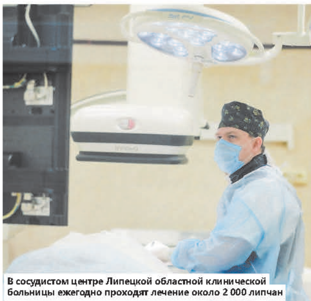
В сосудистом центре Липецкой областной клинической больницы ежегодно проходят лечение около 2 000 липчан

— Мы обслуживаем около 70 тысяч населения. На нашей территории расположены 23 ФАПа, семь амбулаторий и так далее. Если каждому подразделению дадим по машине, врачи у нас есть, это повысит доступность, быстроту обслуживания. Водителям, медикам, да и паци-