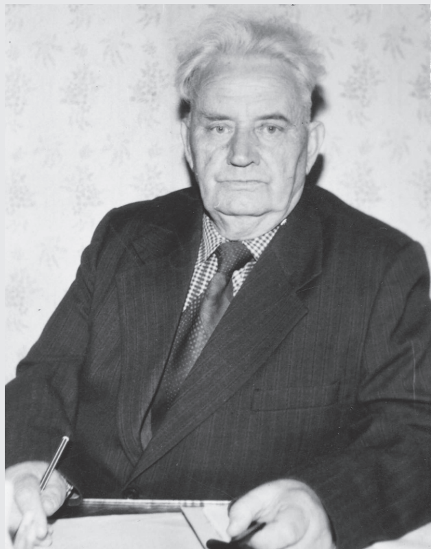
ПЕРВЫЙ БОЙ - ПЕРВЫЙ ПОДВИГ

живших. Но полуголодные, плохо вооруженные солдаты с отчаянием держались за клочок волжской земли. За так недавно прекрасный город Сталинград, за каждую его улицу и дом. И как бы высокопарно это ни звучало, но это великая истина: своей кровью, ценой жизни, многочисленными потерями, мы отстояли и город, и нашу страну. Мы победили в той битве, и вселили во всех веру, что победим и в войне”.