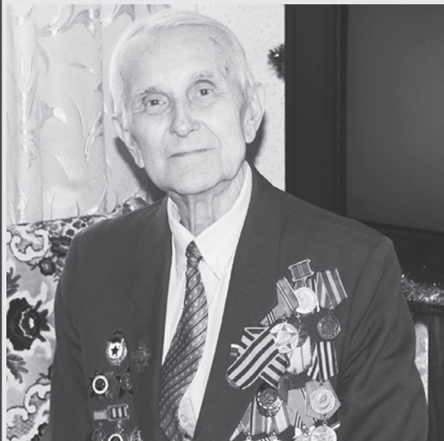
ВСЕЛИЛИ ВО ВСЕХ ВЕРУ, ЧТО ПОБЕДИМ

В кровопролитных боях за город на Волге участвовало немало наших земляков, к сожалению, ныне покойных. Об их подвигах газета писала множество раз. Вспомним о некоторых из них.