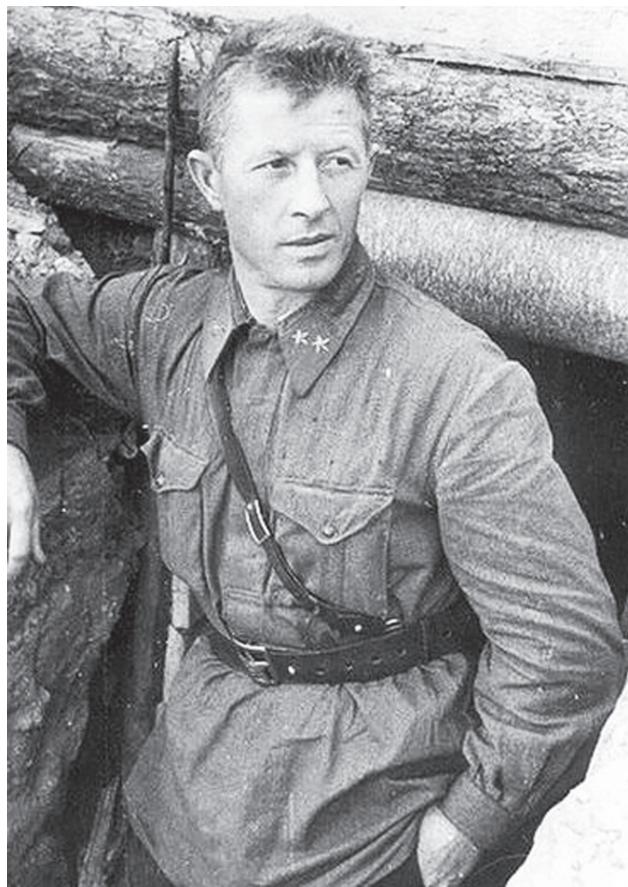
Комдив Александр Ильич Родимцев

Помимо этого, снаружи здания были сооружены четыре отсеченные огневые точки, соединенные с подвалом подземными ходами. Канализа-