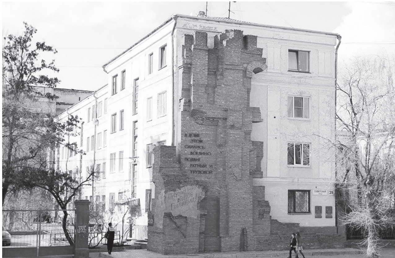
Обратная торцевая часть Дома Павлова, выходящая на восток, на улице Советская, как раз в сторону Мельницы и Панорамы Сталинградской битвы.

С одного из зданий, иногда постреливали немцы, но чувствовалось, что их контингент небольшой. Решили послать выяснить ситуацию разведгруппу. В командном составе были ограничены, поэтому командиром разведчиков этой группы назначили сер-