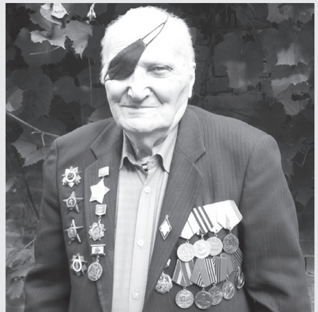
ОТ СМЕРТИ СПАС БОЕВОЙ ТОВАРИЩ

мере приближения к нашим позициям немцы заметно занервничали, было видно, что они боятся рукопашного боя. И тут вдруг поднялась соседняя рота, ее мгновенно поддержали другие подразделения и с мощным “Ура!” двинулись на врага, забрасывая его на ходу гранатами. Гитлеровцы в панике побежали назад, оставляя убитых и раненых. Первый бой показал: не так страшен враг, как его малюют”.