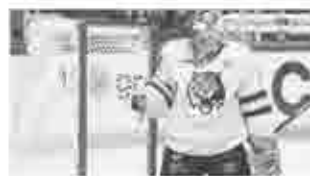
Победную серию ХК «Амур» прервал лидер регулярного чемпионата