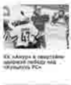
ХК «Амур» в очередной раз выиграл у «Сибиряков» со счетом 3:0