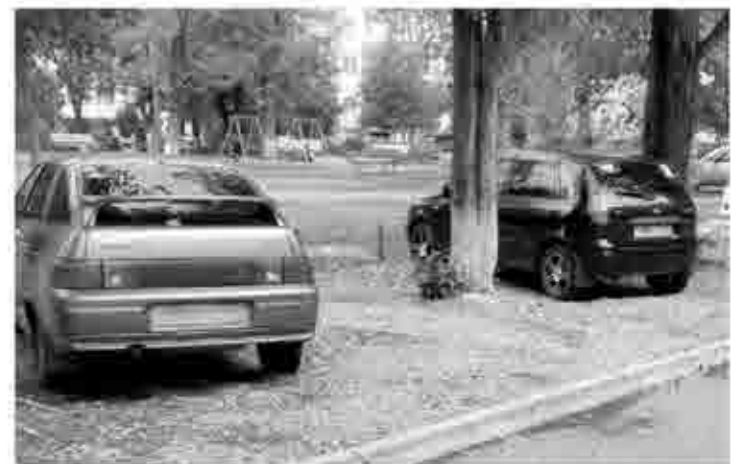
Привычная картина, не правда ли? Но у нас с этим можно бороться

При фиксации правонарушения работающими в автоматическом режиме техническими средствами, имеющими функции фото- и видеозаписи, постановление о наложении штрафа направляется лицу, привлеченному к ответственности, по почте или в форме электронного документа через Единый портал госуслуг (в установленном порядке) в течение трех дней со дня вынесения постановления. Направление электронного документа или информации из постановления возможно также с использованием иных средств информационных технологий или подвижной радиотелефонной связи.