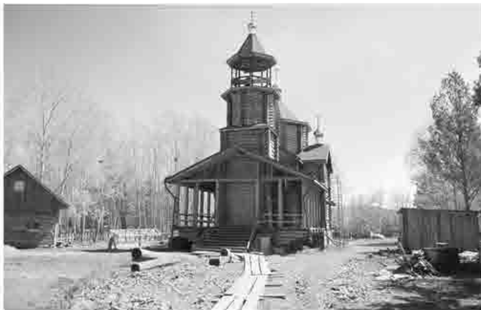
Так храм блаженной Матроны Московской и прилегающая территория выглядят сегодня. До полноценного открытия далековато