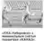
«СКА-Хабаровск» в чемпионате КХЛ проиграл «Амур» со счетом 1:2

Уважаемые читатели, мы ждём ваших сообщений о новостях и актуальных темах т. 8 (4212) 47-55-37 • e-mail: hks@todaykhv.ru