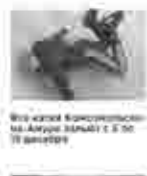
Во второй хоккейной лиге ХК «Амур» выиграл у «Сибиряков» со счетом 3:0