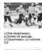
«СКА-Нефтяник» уступил на выезде «Спартак» со счетом 0:2