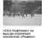
«СКА-Нефтяник» на выезде проиграл «Спартак» со счетом 0:2