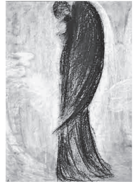
Художник Микалоюс Чюрлёнис