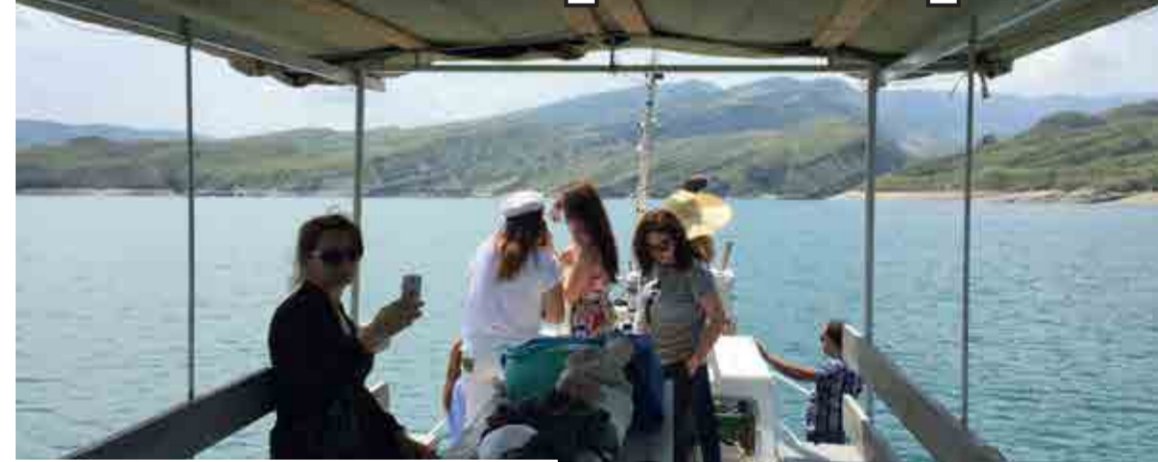
Вид на Чиркейское водохранилище