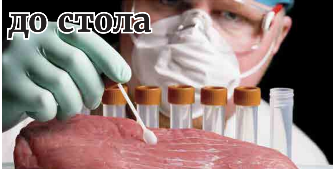
Вся мясная продукция должна быть качественной